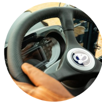
1. 파워 스티어링

ISEKI 트랙터는 강력한 엔진 성능과 첨단 메커니즘을 갖추고 있습니다.