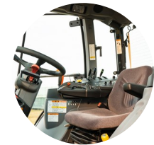
4. 고급 캐빈