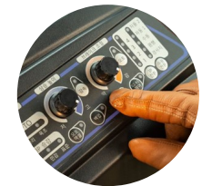
5. 전자 유압 스위치 패널