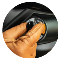
3. 4륜 전환 다이얼