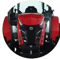
1. 타이거 페이스 후드 디자인

2023년, 꾸준히 축적해온 기술과 디자인으로 TYM 만의 과학 기술 농업을 향한 철학을 선보입니다.