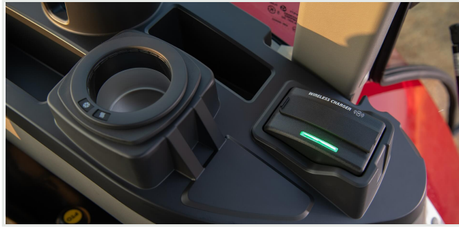
스마트폰 무선충전기 및 냉온 컵 홀더(고급형)

정밀한 독일 엔지니어링에 기반한 도이츠 엔진은 중저속 RPM에도 고출력, 고토르크를 자랑합니다. 또한 고장이 적고 수명주기가 길어서 생산성이 뛰어납니다.