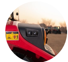
6. 외부 히치 제어 스위치(좌우 적용)