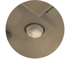
4. LED 실내등