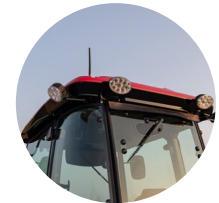
5. 측후방 LED 작업등