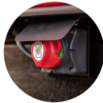
2. 배터리 차단 스위치