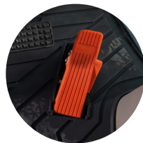
3. 전자 오르간 페달