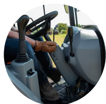
2. 틸트 핸들