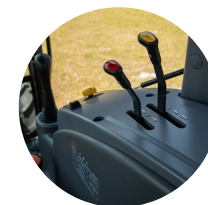
4. 외부 유압 조작 레버