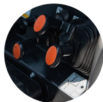
1. 집중식 레버