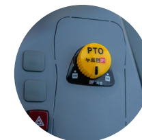
5. PTO 스위치