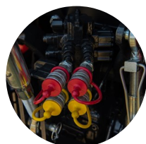
3. 외부 유압 밸브